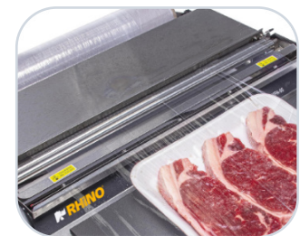
Sistema de corte con calor