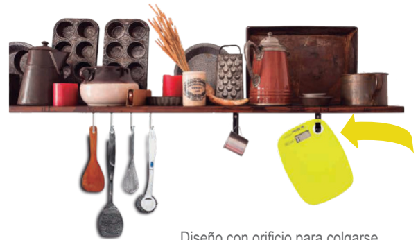
Diseño con orificio para colgarse